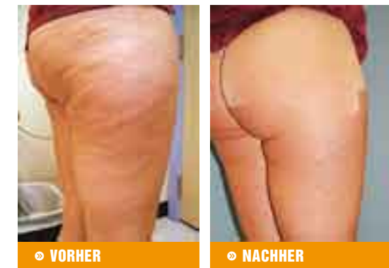
Mit VelaSmooth: überragende Resultate – weniger Konsultationen.

«VelaSmooth verkörpert die Erfahrung und Zuverlässigkeit des medizinischen Berufsstandes und gibt den Ärzten und dem medizinischen Fachpersonal somit ein überzeugendes Instrument in die Hand, um den Ästhetikbereich auszubauen», ist Kontostavlos überzeugt.